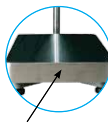
Plateau de pesée en inox 304