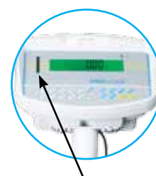
Voyants LED pour le contrôle de pesée